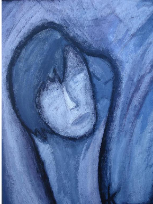
27: Finds love in all the wrong places

Haiko en Munch: ik zie hier een verwantschap is het de beweging, wat is het voor eigenschap?