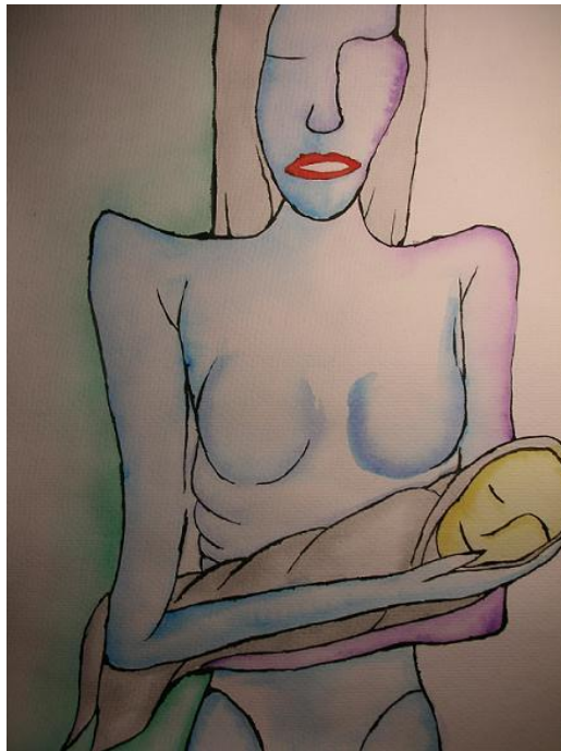
A35: The hard part of holding on is letting go