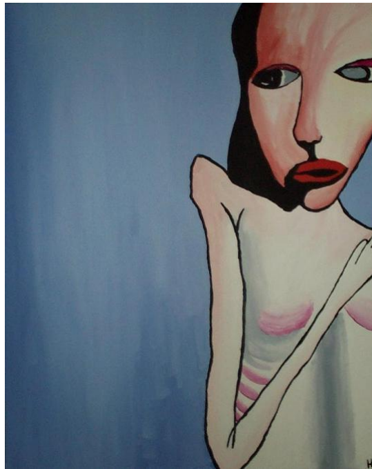
21: In love with Shame